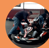
Sorties Karting, Bowling et Laser Game pour l'ESAT du Breuil