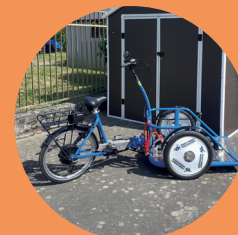
Vélo plateforme pour l'EAM Arc-en-ciel