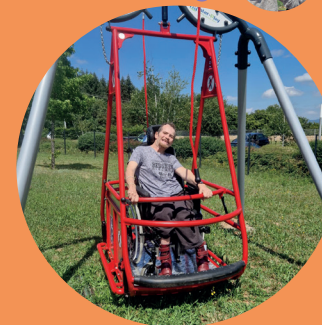
Balanoire PMR pour la MAS Le Replat